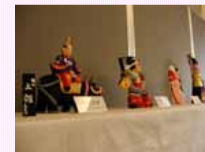
ミニギャラリーの様子