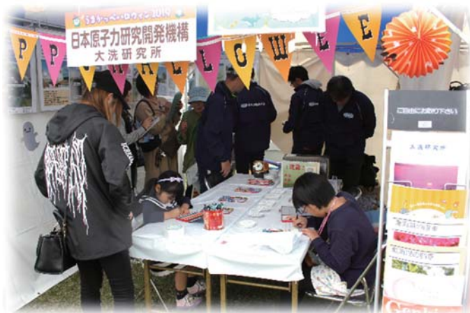
▲ 銚田うまかっぺハロウィン

今後もこのような活動を通じて、地域の皆様への理解促進並びに地域共生に積極的に取り組んでまいります。