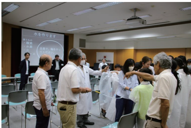
▲爆鳴気実験で大きな音がなると会場はとても盛り上がりました。

また会場内にサイエンスカレッジ内で作成するビスマス結晶（レアメタル）の実物が展示されるなど、サイエンスカレッジや科学の面白さを感じさせる会場となりました。本事業をはじめ、大洗研究所は様々な教育事業への協力を通じ、次世代を担う子ども達の科学する心を育むとともに、科学技術全般の知識の普及・啓発活動を進めていきます。