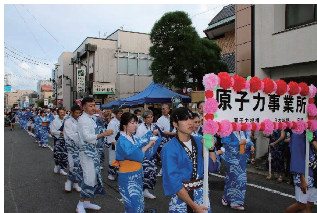
▲約600mの道のりを磯節パレードしました。