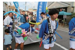
▲バルーンアートも大盛り況

また、パレード後方では、原子力事業所が共同で作成したうちの配布によるPR活動に加え、剣や花、動物などのバルーンアートを作り子供たちにプレゼントするなど、地域の皆様との交流を通じて、原子力に対する理解と地域との共生を促進するための活動を行いました。