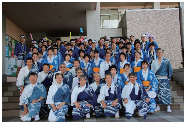
▲原子力3事業所が集合しました。