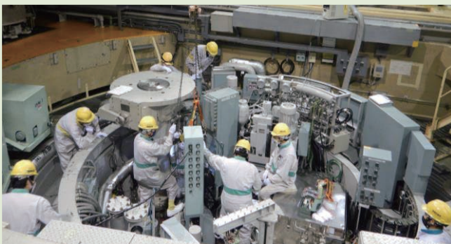
原子炉容器上に設置された装置の分解点検

高速実験炉「常陽」 熱出力：10万KW（100 MW） 冷却材：ナトリウム 燃料：ウラン・プルトニウム混合酸化物