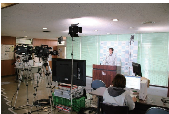
大洗研究所の事務本館ロビーが、ニューススタジオのようになりました。

★施設公開の動画は、大洗研究所ホームページで配信していますので、ぜひご覧ください。