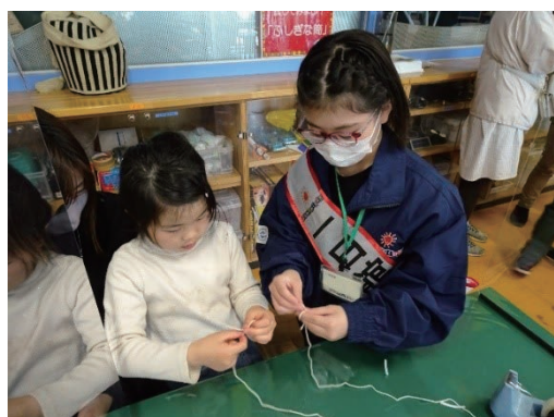
かんたん工作での講師の様子

「科学技術週間」は、4月19日～4月23日まで実施され、わくわく科学館では、科学技術映像祭入選作品を毎日上映するなどし期間中514名の方々にご来館いただきました。