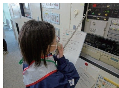
館内への開催案内放送

その後、当日開催された、かんたん工作「スルスルクライマー」では、館内放送も行い、教室では講師として小さなお子様にも優しく声をかけ、分かりやすく丁寧に教えていました。