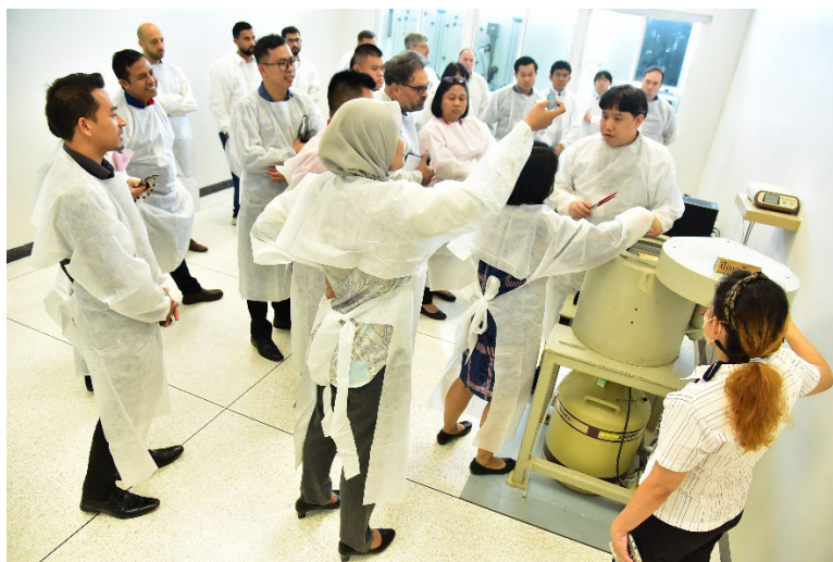
OAPの核鑑識ラボにおける演習の様子

わせた演習を行ったため、それぞれの機器でどのようなデータを得られるのか、又どのように解釈すれば良いか理解できた、など非常に好意的な意見を得ることができた。本コースの共催であるOAPの核鑑識チームに加えて外部講師(EC-JRC、米国エネルギー省)の多大なるサポートに対し、改めて感謝の意を表明したい。