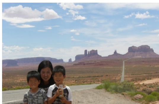
モニュメントバレーに続く道

生まれてから現在まで、1年間だけ主人の仕事の都合によりカルフォルニアで生活した経験がありますが、それ以外はずっと茨城県に住んでいます。カルフォルニア滞在中は、サンフランシスコやニューヨークに旅行へ出かけたり、ディズニーランドやレゴランドに通ったりしました。中でも、ラスベガスを経由して、グランドキャニオン、ブライズキャニオン、アーチーズ、モニュメントバレーなどの世界屈指の国立公園群(グランドサークル)を巡り、神秘的で壮大な大自然を体感しながらコロラド・スプリングスまで 10日間かけて車で旅行したことが一番の思い出です。ただ私が一番行きたかったアンテロープキャニオンには、当日子供が熱を出してしまい行くことが叶わなかったことが心残りです。