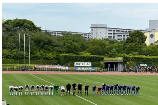
AGF フィールドでの関東大会

休日は二男のサッカーの試合の応援に行くことを楽しみにしています。昨年まではコロナ禍のため観戦に制限がある試合となっていました。今年からは制限なく観戦できるようになり何度も応援に行くことができます。良い結果の試合も残念な結果の試合もありますが、頑張っている姿を間近で見られることに幸せを感じています。二男は高校3年生なので、高校生最後の大会が冬に行われる全国高校サッカー選手権大会となります。それまで、できるだけ多くの試合に応援に行きたいと思っています。