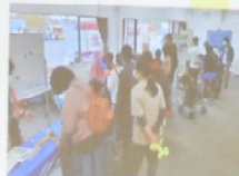
むつ下北未来創生キャンパス(久保)(10/29) 科学工作体験等 原子力機構ブース 来場者309人