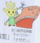
むつ科学技術館キャラクター「ナゼボン」