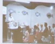
毎週開催たのしい実験教室