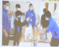
サイエンスクラブ