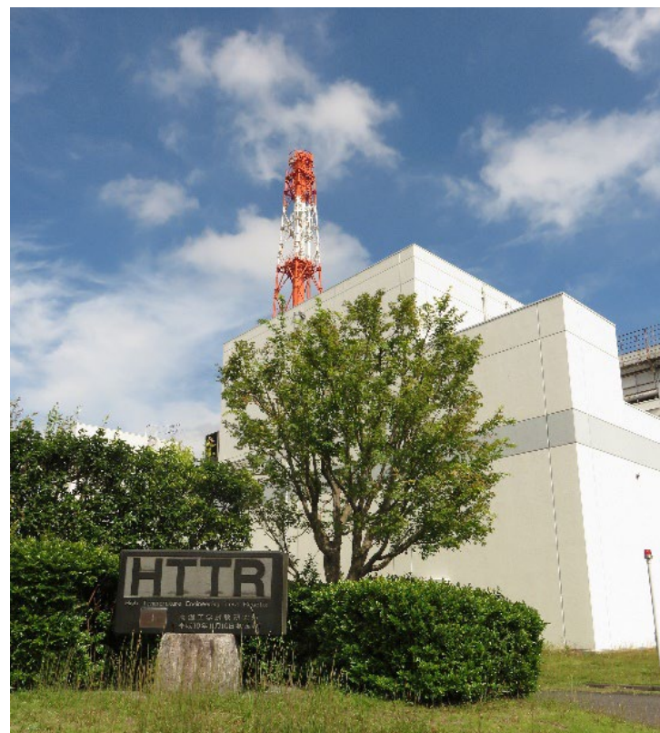
設置場所：大洗研究所（茨城県大洗町）